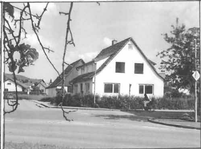
Das Anwesen Link/ Familie Ludwig Gysin, fotografiert vor dem Abbruch 2013