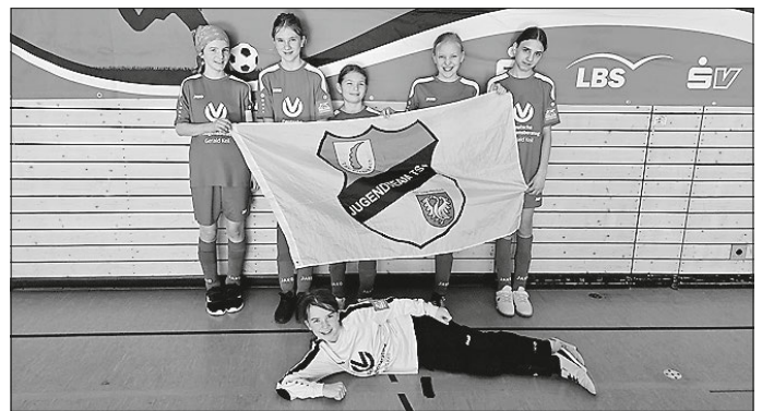
Unsere Mädels sind Vierte im Bezirk

Habt ihr auch Lust mitzumachen? Dann kommt doch zum Schnuppern ins Training vorbei: Weitere Infos gibt es auf www.tsv-pfedelbach.de