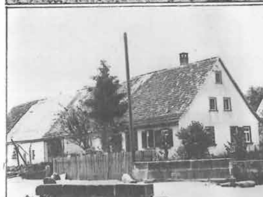
Bild oben vom Anwesens Link um 1950 mit der Brücke über den Pfedel-Bach