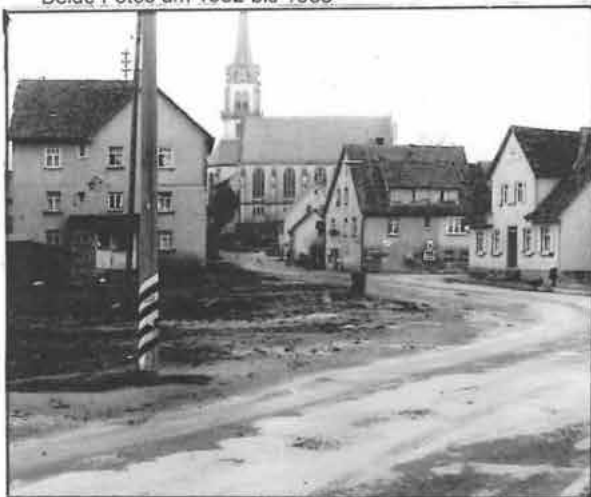
Foto vom 8.4.1965 von Photo Hirlinger,anlässlich der Verdohlung des Pfedel-Bachs