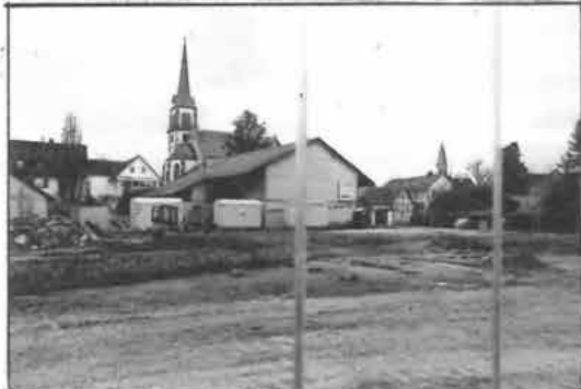
Foto mit Blick zur Evangelischen Kirche vom 20.4.2021

Links: Beide Bilder zeigen Arbeiten in der Ecke Kirchgasse und Kelterstraße vom 6.4.2021-18.6.2021, bei denen Archäologische Befunde im Bereich des Prüffalls „Mittelalterlicher und frühneuzeitlicher Ortskern Pfedelbach“ erfasst und dokumentiert wurden. Die Fachaufsicht-führende Behörde war das Landesamt für Denkmalpflege im Regierungspräsidium Stuttgart, Referat 84. 2, Dienstsitz Esslingen. Die Bauarbeiten in der Kelterstraße wurden danach durchgeführt.