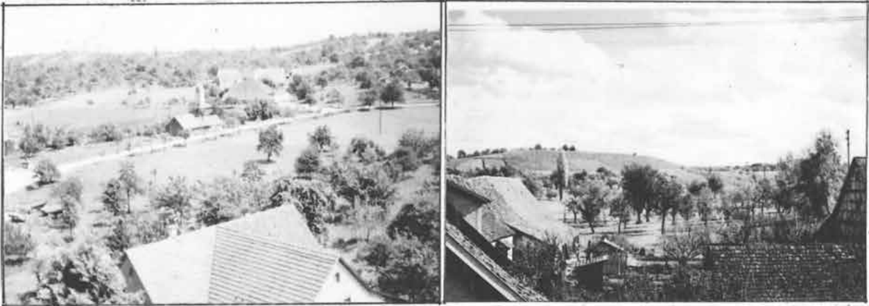
Links: Blick zur Kelterstraße und zur Wiesenkelter. Rechts: Blick zum Nonnenberg und zum Backhaus hinter dem Haus Link Beide Fotos um 1952 bis 1955