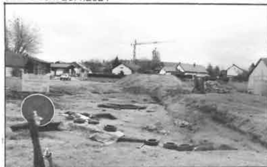
Foto mit Blick zum Nonnenberg vom 20.4.2021

Links: Beide Bilder zeigen Arbeiten in der Ecke Kirchgasse und Kelterstraße vom 6.4.2021-18.6.2021, bei denen Archäologische Befunde im Bereich des Prüffalls „Mittelalterlicher und frühneuzeitlicher Ortskern Pfedelbach“ erfasst und dokumentiert wurden. Die Fachaufsicht-führende Behörde war das Landesamt für Denkmalpflege im Regierungspräsidium Stuttgart, Referat 84. 2, Dienstsitz Esslingen. Die Bauarbeiten in der Kelterstraße wurden danach durchgeführt.