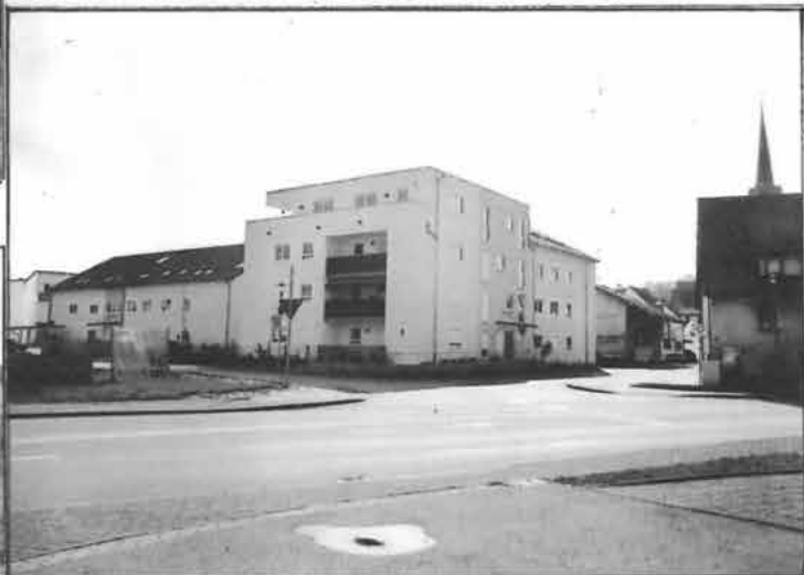
Blick zur Kelterstraße und zur Kirchgasse mit der neuen Wohnbebauung vom 4.3.2024.