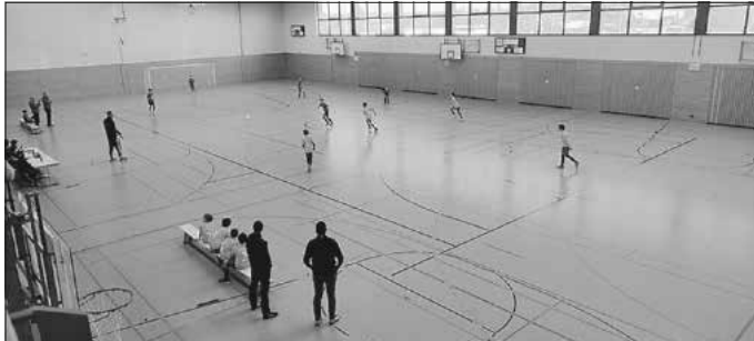
Team 2 im Einsatz

Am 15. Februar sind wir noch zu Gast in Waldenburg. Danach ist für uns die Hallensaison beendet.