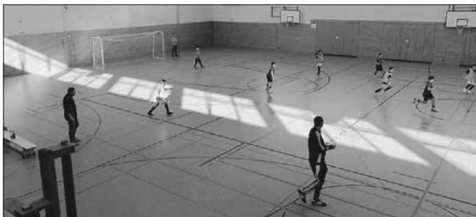
Volle Power zeigte Team 3