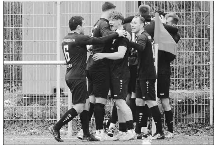
Lang hatte es gedauert bis die Pfedelbacher Spieler jubeln durften

Pfedelbach steht damit im Pokalachtelfinale, das voraussichtlich am Mittwoch, den 2. April 2025, stattfindet.