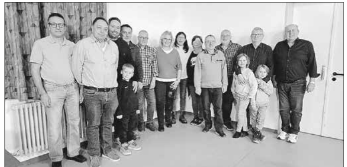
Die neu gewählten und ausscheidenden Ausschussmitglieder

Mit einem Ausblick auf das Jahr 2025 sowie einem gemeinsamen Vesper schloss die Veranstaltung.