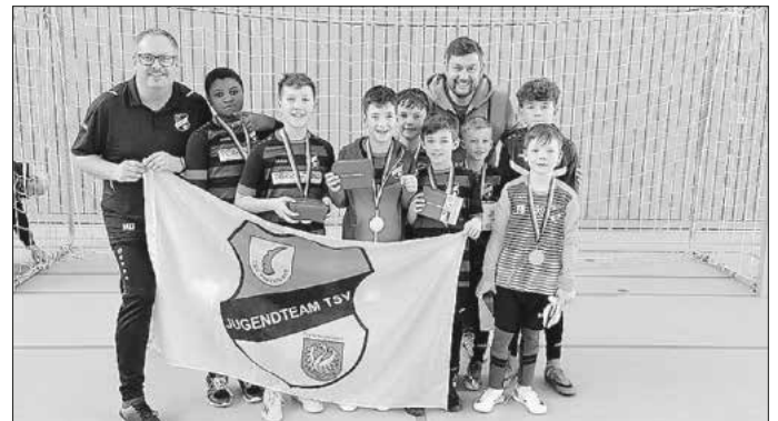
Spieler und Trainer freuen sich über den zweiten Platz

Wir starten nun in die Vorbereitung auf die Rückrunde. Dazu haben wir einige Testspiele vereinbart.