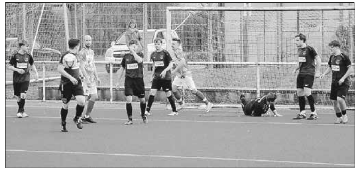
Pfedelbach II musste sich Verrenberg geschlagen geben