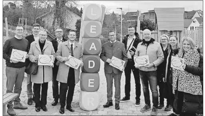
Minister Hauk besucht die Limesregion Hohenlohe-Heilbronn an der neuen Dorfmitte in Baumerlenbach

Im Mittelpunkt standen die Besichtigung konkreter Projekte und der Austausch mit den Akteuren vor Ort über die Zukunft der Förderprogramme. Der Besuch verdeutlicht die hohe Wertschätzung des zuständigen Ministeriums (MLR BW) für das bürgerschaftliche Engagement und die Innovationskraft in der Region.