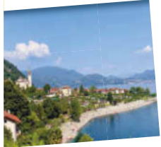
Lago Maggiore ITALIEN