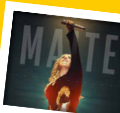
Maite Kelly TOUR 2027