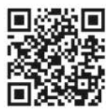
Die Vielfalt der Hohenloher Perlen in vier neuen Broschüren entdecken.