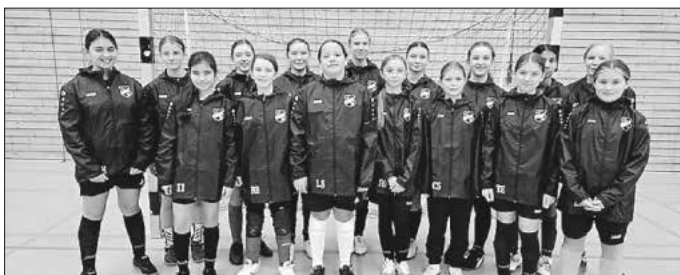
Unsere D-Juniorinnen spielten eine starke Hinrunde

Wir sind stolz auf jede Einzelne und freuen uns darauf, diesen Weg gemeinsam weiterzugehen. Mit dieser Entwicklung kann es nur gut weitergehen – wir sind gespannt, was die kommende Saison bringt!