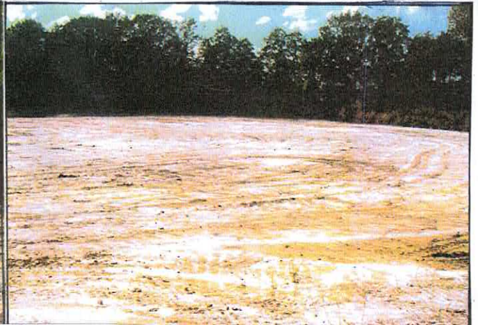
Bilder vom ausgebaggertem Buchhorner See