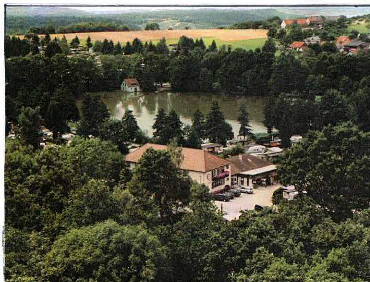
Die Fotografie oben ist 2001 von Herrn Adolf Zimmer, Pfedelbach, an die Heimatsammlung geschenkt worden.