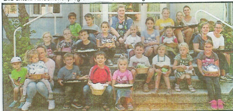
Das Backhaus von Gleichen wurde 1878, also vor fast 150 Jahren erbaut und wurde in der Regel alle 2 Wochen genutzt. Heute werden vom Allg. Bürgerverein Gleichen anlässlich der jährlichen Kinderferienprogramme unter Anleitung der Gleichen-er Frauen die Backhausfeste organisiert und für die Kinder ist dies ein unglaubliches Erlebnis, in diesem von der Gemeinde gekauften, renoviertem und am 12. Juni 1988 eingeweihtem Backhaus wie zu Großmutter's Zeiten backen zu lernen und danach die Köstlichkeiten mit Genuß verzehren zu können. Darüber gibt es nun sehr viele Berichte in der Hohenloher Zeitung und im Pfedelbacher Gemeindeblatt.