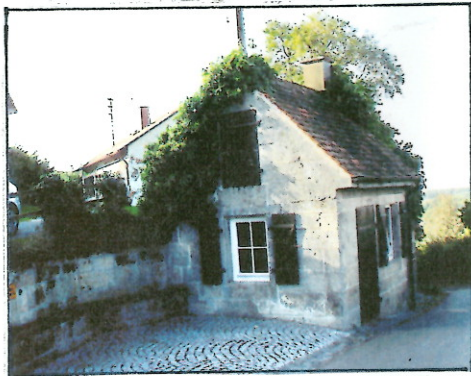
Oben: Plakat von 1988 Unten: Das Backhaus von Gleichen Foto von 2005