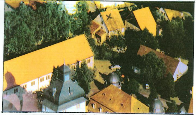
Bild oben mit dem Haus von Wilhelm Bolz ✕ Links das Wappen am Haus