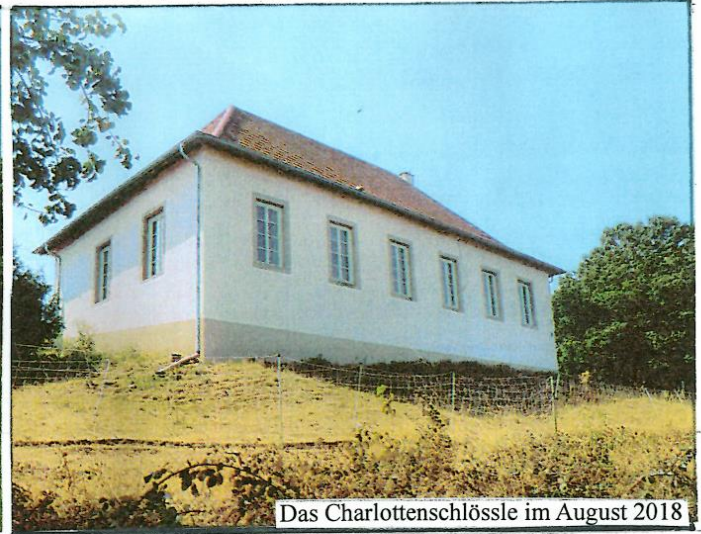
Das Charlottenschlössle im August 2018