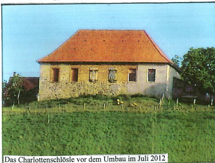
Das Charlottenschlössle vor dem Umbau im Juli 2012

Bild oben: Das Charlottenschlössle als Ausschnitt von einer Luftaufnahme vom Jahr 1935, die in der Heimatsammlung im Original vorhanden ist. Nach dem Beschuß in den letzten Kriegstagen im April 1945 brannte das Charlottenschlössle zum Teil ab und das Hauptgebäude wurde nach dem Wiederaufbau nur noch als Stall und Scheune genutzt. An Stelle der Scheune vorne rechts wurde das Wohnhaus errichtet und der rechte Seitenflügel, in dem auch ein Keller von 1720 ist, wird als Holz- und Geräteraum genutzt. Das Charlottenschlössle ist in der Grundfläche 20x10 Meter groß und hat ringsum ca. 80 cm dicke Mauern.