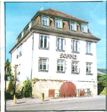
Oben das Gebäude der „Sonne“ im September 2021