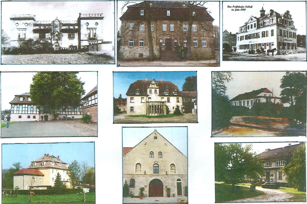
Oberste Reihe v.l.n.r.:Feldschloß Meuselwitz (Sachsen), Gut Nausitz (Thüringen), Schloß Prößdorf, Sachsen-Anhalt. Mittlere Reihe v.l.n.r.:Rittergut Steinsee,(Thüringen), Rittergut Pauscha (Sachsen-Anhalt), Rittergut Rathstock (Brandenburg). Untere Reihe v.l.n.r.:Rittergut Lauske, (Sachsen), Rittergut Zscheiplitz, (Sachsen-Anhalt), Rittergut Reichenberg,(märkische Schweiz).

Das Dorf Tettenborn besteht aus dem älteren Teil, in dem auch das Stammgut lag und einer weiteren Siedlung (Tettenborn-Kolonie). Der ältere Teil des Dorfes hat ca. 400 Einwohner und zusammen haben sie ca. 650 Einwohner.