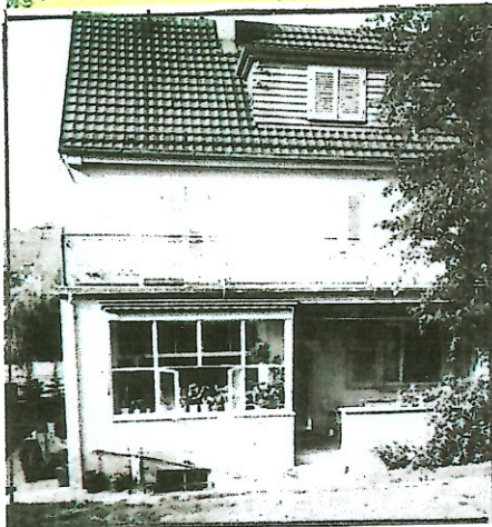
Oben: Das Haus in der Pfühlstraße

Links: Werbung der Firma Brenner-Schilling zum 125-jährigen Jubiläum 1846-1971