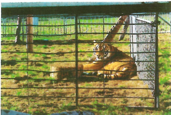
Ein Königtiger des Zirkus Manuel Weisheit

Oben Mitte Plakat des Weihnachtszirkusses Mulan von 2015 in Pfedelbach Rechts oben das Zelt des Zirkus Baruk, darunter die Eintrittskarte von 2016 dazu. Die Artistenfamilie ist in der 7. Generation und stammt aus Thüringen und ist ein mittelständiger Wanderzirkus mit einem Kuppelzelt für 1000 Personen. Dazu gibt es noch einen Streichelzoo als kleinen Freizeitpark Die Veranstaltungen waren zusammen mit dem Kreisdiakonienverband Hohenlohe und dem Freundeskreis Asyl Öhringen für ein Friedliches und Fröhliches Miteinander organisiert worden und wie man sah mit vollem Erfolg Links Werbung des Zirkus Manuel Weisheit, der im Oktober 2017 in Pfedelbach gastierte Die Zirkusfamilie ist seit 1824 im Showbusiness tätig und seit 1988 als eigenes Unternehmen selbstständig. Mit ihren 20 historischen und selbst restaurierten Zirkuswagen sind sie jedes Jahr in 60 Gastspielorten in Deutschland und im Elsass mit einem 2-stündigem Programm unterwegs. Der Zirkus hat schon die ganze Welt bereist wie aus dem ansprechenden Programmheft zu erfahren ist. Ihre Kinder haben schon mit 3-5 Jahren eigene Auftritte. Man erfährt, dass ein junger Tiger erst nach 2 ½ Jahren richtig ausgebildet ist und sie haben 4 sibirische Königstiger die alle im deutschen Zirkus geboren wurden.