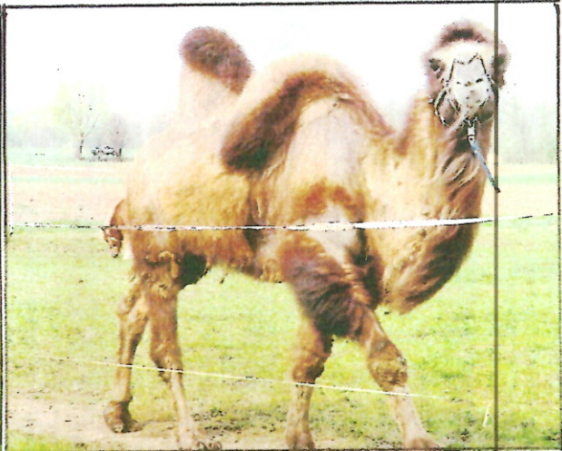
Steppenkelmel des Zirkus Henry