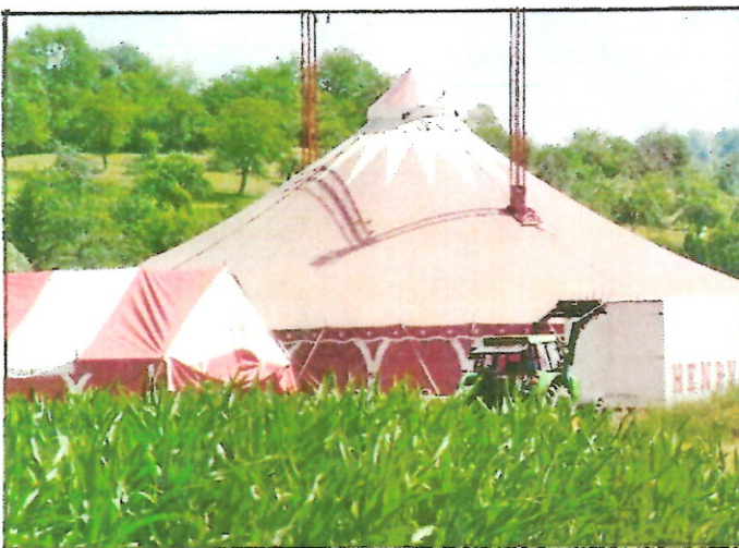
Zirkuszelt des Zirkus Henry

100 Jahre später, 2012, fast um die gleiche Zeit war der Zirkus Henry zu Vorstellungen in Pfedelbach hinter dem Lidl-Markt