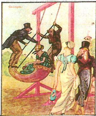
Die Schaukel ist schon im Altertum bekannt und war ein Wunschtraum, das Fliegen zu verwirklichen

Von vor 1950 gibt es fast keine Fotos von den oben beschriebenen Objekten, denn bei den Kinder-, Sanger-, oder Sportfesten waren die Festzuge zu fotografieren das wichtigste, da man sich da am besten reprasentieren konnte. Da man da die Vergnugungen, die doch fur Gross und Klein das wichtigste auf dem Festplatz waren, nicht im Bild festgehalten hat, gehort eigentlich zu den groen Ratseln. Wenigstens standen bei den Anzeigen in den Hohenloher Boten die Besitzer dieser Vergnugungen dabei und so konnte man sich ihr Einzugsgebiet gut vorstellen. Manche Darbietungen gab es auch wegen eines Gartenfestes, einer Einweihung oder sonstigem Anlass. Das Heimatblatt bietet nun einen Streifzug von den Geschehnissen seit dem Jahr 1881 in den verschiedensten Orten der Gemeinde.