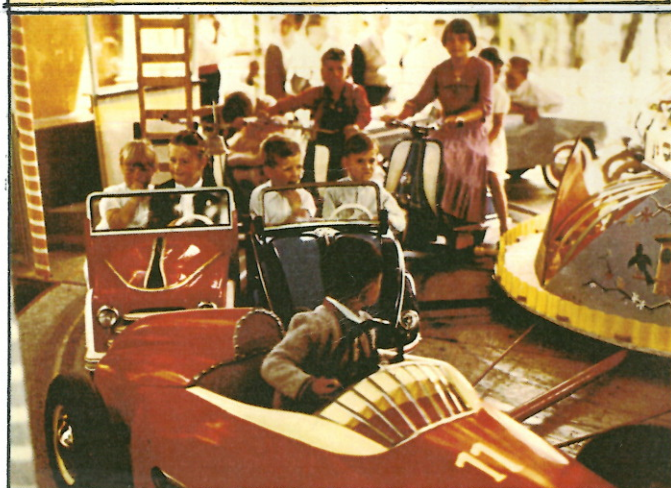
Bilder oben: Kinderkarussell der Firma Erwin W. Zöllner

Bei den Kinderkarussell-Angeboten gab es das was die Herzen von Buben und Mädchen höher schlagen ließ, nämlich Polizei- und Feuerwehrautos, Rennwagen und Luxus sportwagen, Motorräder und Motorroller, lustige Tiere wie z.B. Micky Maus, Fantasiegestalten, Schaukeln, Pferde kutschen und Planwagen.