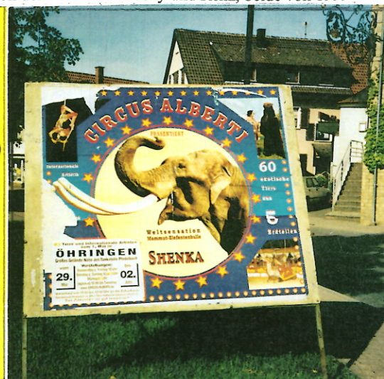
Links: Plakat des Zirkus Central 2002, rechts: Plakat vom Zirkus Alberti von 2003 im Dorf