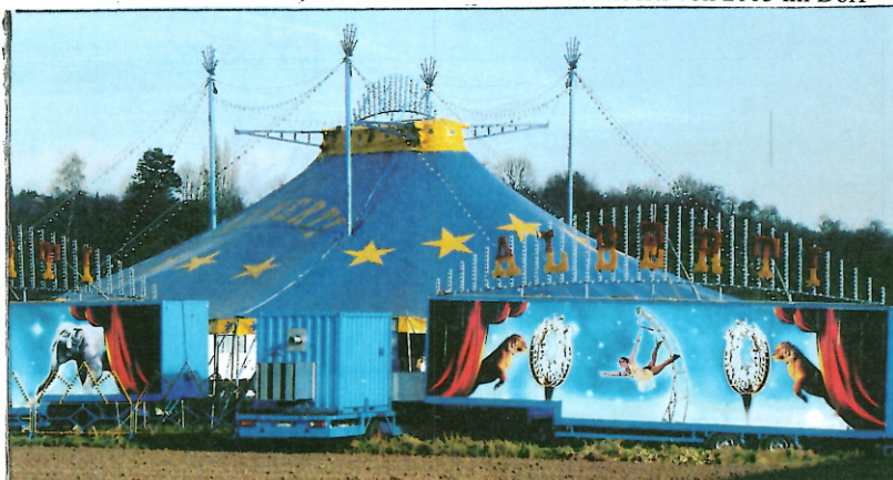
Links: Plakat vom Zirkus Alberti von 2008 und oben das Zirkuszelt 2008