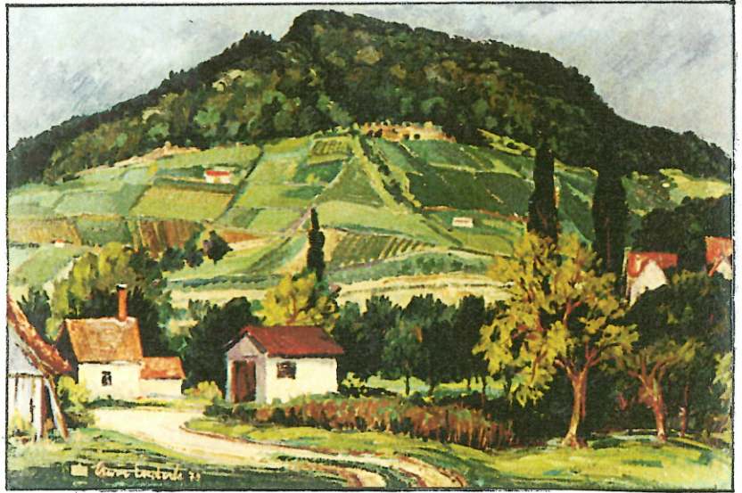
Blick zum Wilfersberg, Gemälde von Erwin Enderle, Heuberg von 1971

Durch den Rathaus-Neubau 1967 mußte das Waaghäuschen in Oberhöfen entfernt werden. Man fand in dem Garagengebäude zwischen dem Anwesen Geist und Schwarz, im Kernerweg von Harsberg den entsprechenden Raum dafür, siehe Fotos links und oben. 1999 wurde der Waagedienst eingestellt und 2009 fanden das Waage- und Firmenschild den Weg in die Heimatsammlung der Gemeinde Pfedelbach.