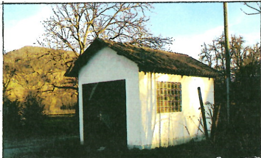
Das Waaghäuschen in Harsberg, Fotos von 2008