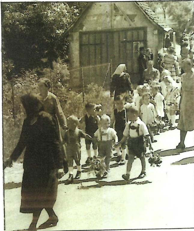
Links und unten sind die einzigen Bilder des Spritzenhauses, in dem die Viehwaage von Windischenbach untergebracht war. Die Bilder wurden anlässlich von Festzügen bei einem Kinderfest und von der Feuerwehr in den 50er Jahren gemacht